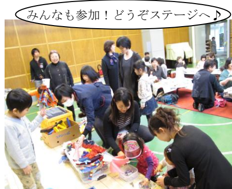
みんなも参加！どうぞステージへ♪