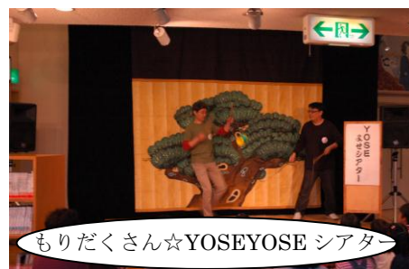
もりだくさん☆YOSEYOSE シアタ