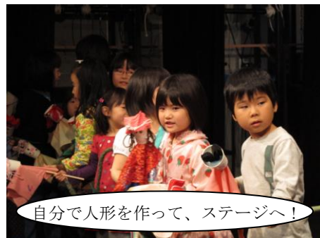
自分で人形を作って、ステージへ！