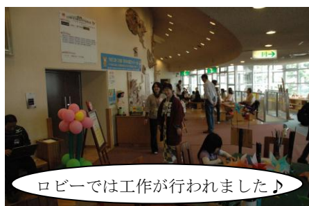
ロビーでは工作が行われました♪