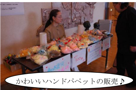
かわいいハンドパペットの販売♪