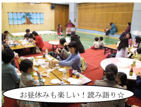
お昼休みも楽しい！読み語り☆